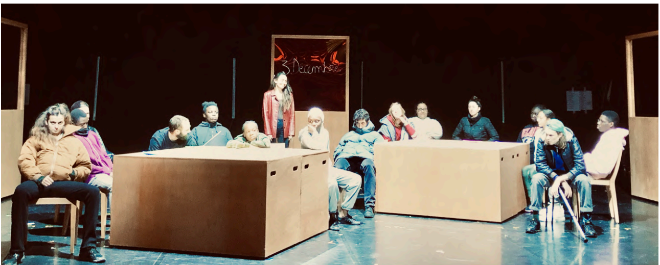
Répétitions avec des adolescent·e·s du Centre Kirikou (Paris 17ème), lors de notre résidence au Théâtre Brétigny - Scène conventionnée

Ainsi, des représentations incluant des élèves au plateau seront jouées au Théâtre Brétigny-Scène conventionnée, au Théâtre de la Nacelle à Aubergenville, au Théâtre de Suresnes, au Théâtre dans les vignes à Couffoulens, au Théâtre de l'étoile du Nord à Paris.